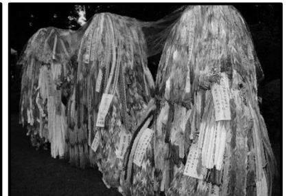
全国から奉献された折鶴